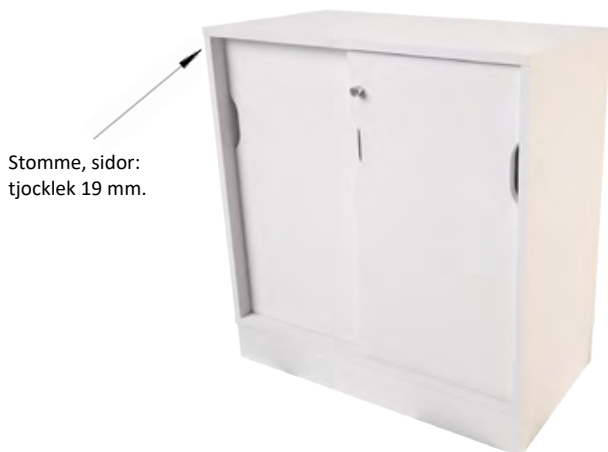
Stomme, sidor: tjocklek 19 mm.